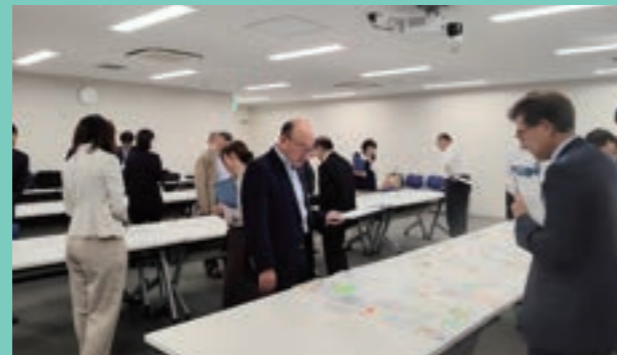
世田谷合同庁舎会議室で行われた審査会の様子